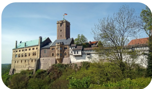
Lernen mit Aussicht